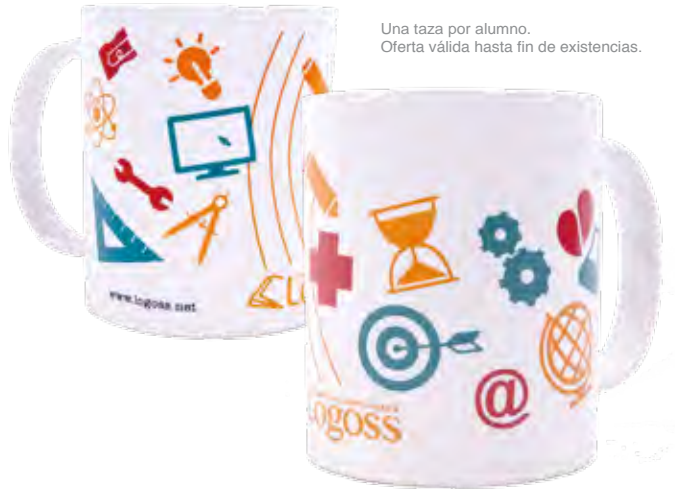
Una taza por alumno. Oferta válida hasta fin de existencias.

Matriculándote en cualquiera de los cursos de este catálogo (salvo en: “SALUD LABORAL: PREVENCIÓN DE RIESGOS LABORALES” y “ACOSO LABORAL EN EL ÁMBITO SANITARIO”) recibirás junto con el material del curso una TAZA .