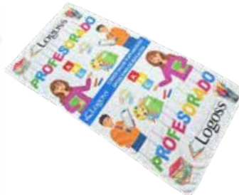
BOLSA TÉRMICA PARA ALIMENTOS